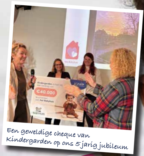
Een geweldige cheque van Kindergraden op ons 5 jarig jubileum