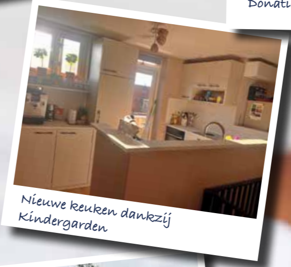
Nieuwe keuken dankzij Kindergraden