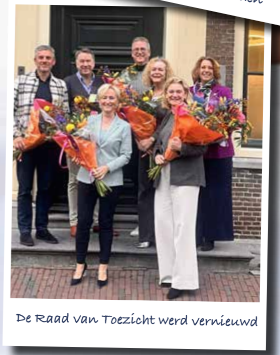
De Raad van Toezicht werd vernieuwd