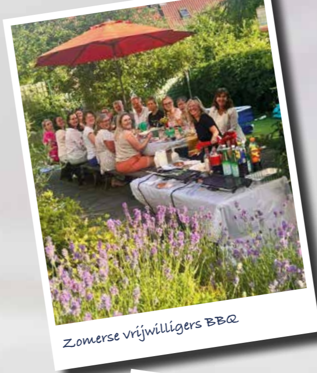
Zomerse vrijwilligers BBQ