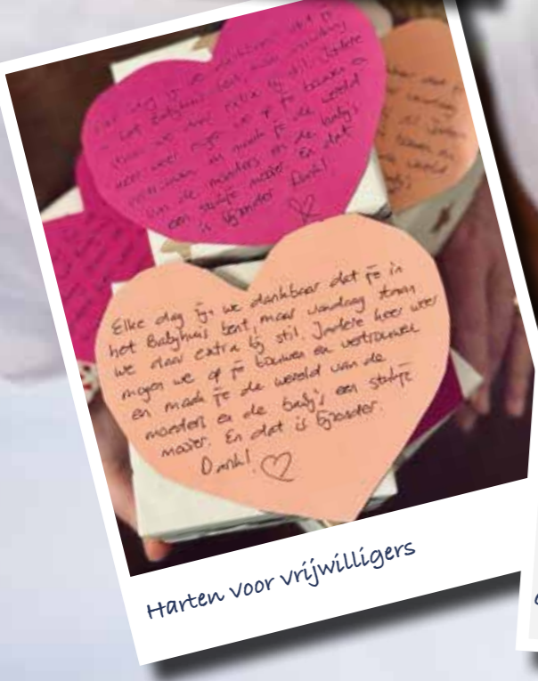
Harten voor vrijwilligers