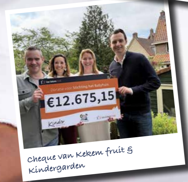
Cheque van Kekem fruit & Kindergraden