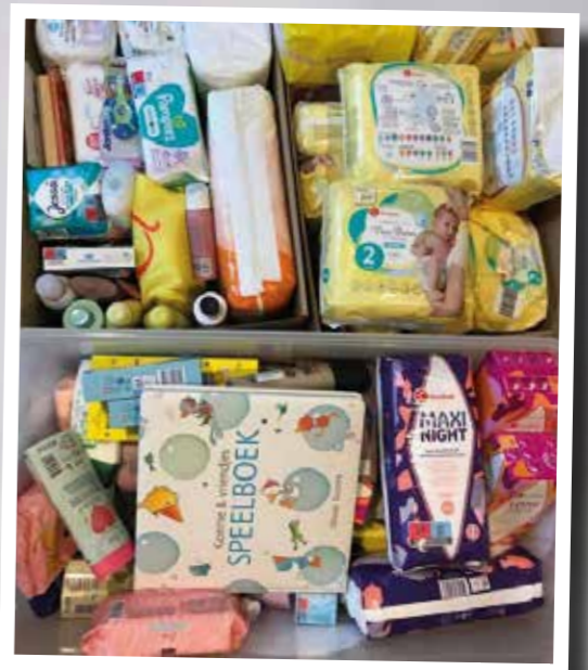
Donatie in natura