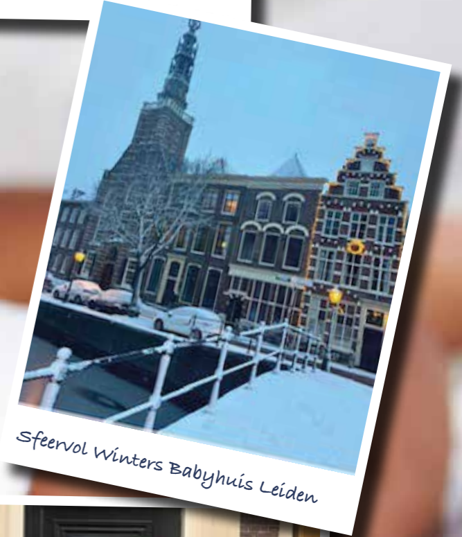
Sfeervol Winters Babyhuis Leiden